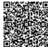
<신청 QR 코드>