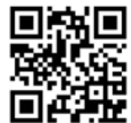
English translations for worship services via Discord